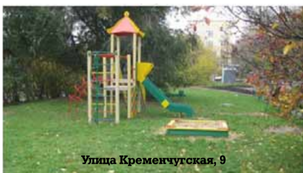
Улица Кременчугская, 9