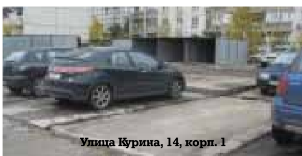
Улица Курина, 14, корп. 1