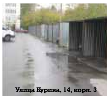
Улица Курина, 14, корп. 3