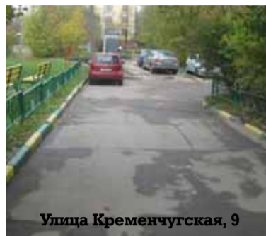
Улица Кременчугская, 9