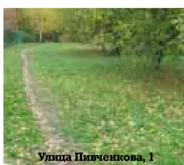
Улица Пивченкова, 1