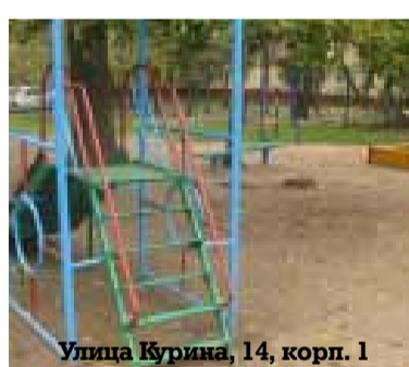
Улица Курина, 14, корп. 1