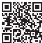
Перечень центров госуслуг